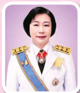
นางยุพา ทวีวัฒนะกิจบวร ปลัดกระทรวงวัฒนธรรม