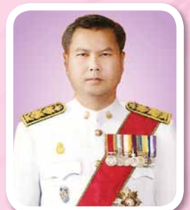
นายสุภัทร จำปาทอง ปลัดกระทรวงศึกษาธิการ