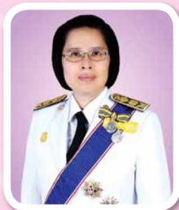
นางสาวอ้นฟ้า เวชชาชีวะ เลขาธิการ ก.พ.ร.