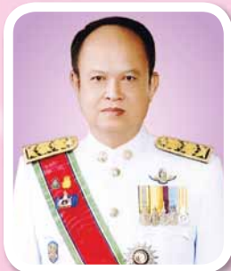
นายทองเปลว กองจันทร์ ปลัดกระทรวงเกษตรและสหกรณ์