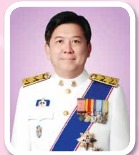
นายจตุพร บุรุษพัฒน์ ปลัดกระทรวงทรัพยากรธรรมชาติและ สิ่งแวดล้อม