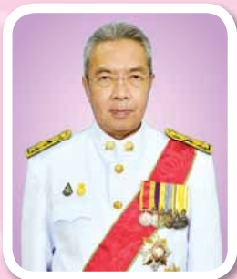
หม่อมหลวงพัชรภากร เทวกุล เลขาธิการ ก.พ.