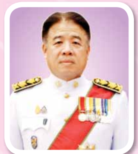
นายไชติ ตราชู ปลัดกระทรวงการท่องเที่ยวและกีฬา