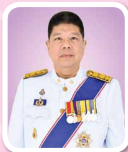
นายธานี ทองภักดี ปลัดกระทรวงการต่างประเทศ