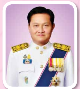
นายสุทธิ สุโกศล ปลัดกระทรวงแรงงาน