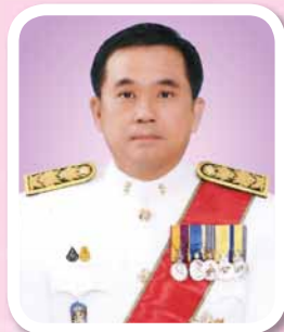
ศาสตราจารย์พิเศษวิศิษฎ์ วิศิษฎ์สรอรรถ ปลัดกระทรวงยุติธรรม