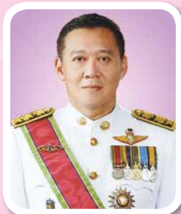
นายชยธรรม์ พรหมศร ปลัดกระทรวงคมนาคม