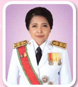
นางพัชรี อาระยะกุล ปลัดกระทรวงการพัฒนาสังคม และความมั่นคงของมนุษย์